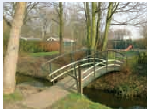
Locatie Klavertje Drie.

Deze ontwikkellocaties betreffen de voormalige boerderij van Van Vliet in Tolhek, het gebied ten noordoosten van het gemeentekantoor aan het Oranjeplein (locatie Oranjepark), een gebied bij de Emmastraat ten noorden van de Van Brachtstraat (huurwoningen Rondom Wonen) en een gebied ter hoogte van Koningshof 9 (locatie voormalige peuterspeelzaal Klavertje Drie).